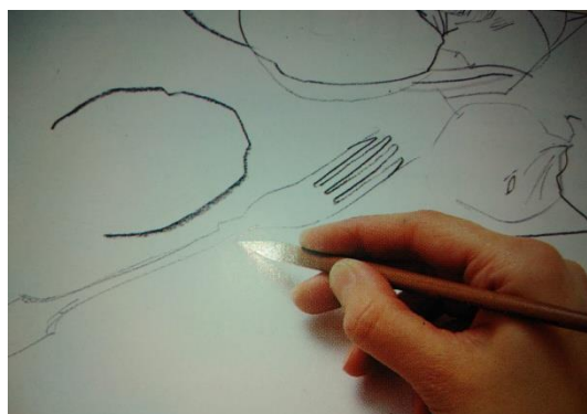
využijte různé tvrdosti tužek