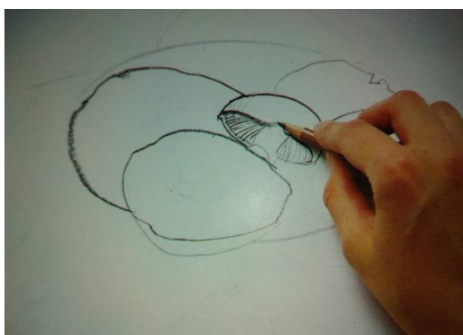
začněte s detaily